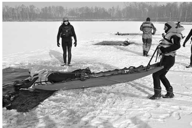
Ćwiczenia z użyciem specjalistycznych san