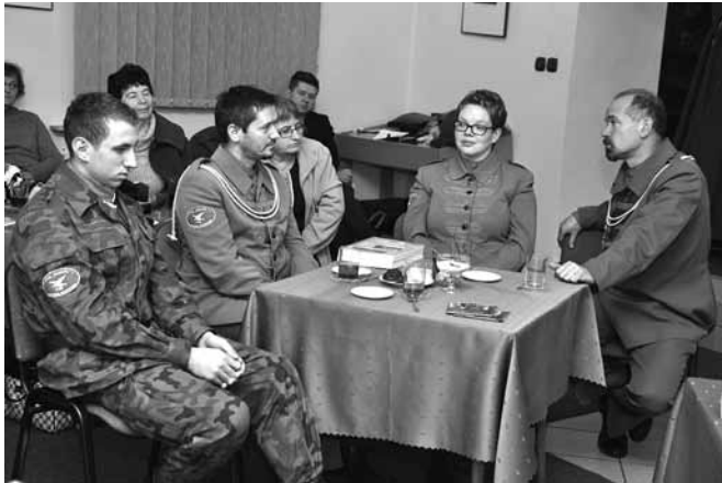
Członkowie PTG „Sokół”