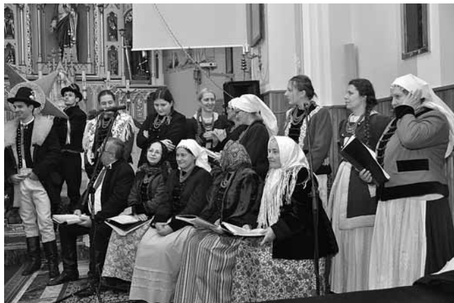
Wystąpił m.in. Zespół Regionalny „Bestwina”

W polskiej tradycji pieśni bożonarodzeniowe śpiewamy zwyczajowo do drugiego lutego. Ostatnie dni stycznia były zatem dla mieszkańców gminy okazją do ponownego przeżycia świątecznych wzruszeń. Licznie uczynili to 29 I na wielkim koncer-