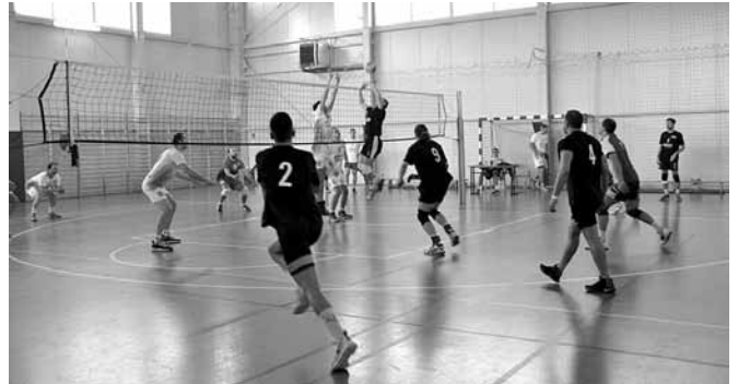
Noworoczny turniej piłki siatkowej mężczyzn

Kolejny turniej, tym razem dla dorosłych, miał miejsce 28 stycznia, również w hali sportowej w Kaniowie. Także i te zawody cie-