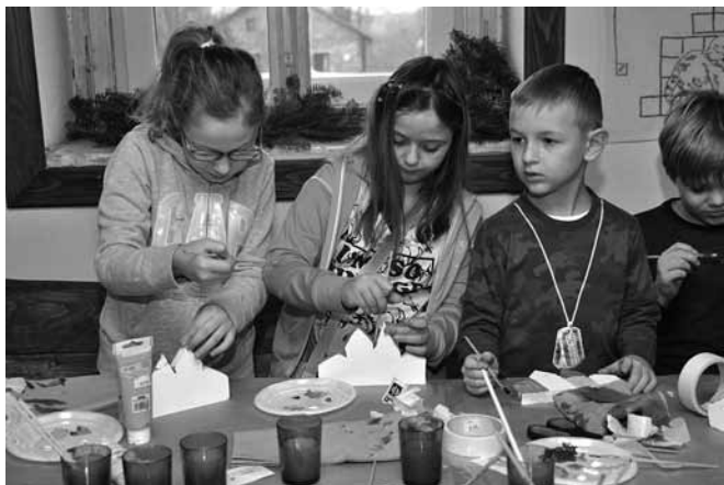
Muzeum Regionalne - tworzenie domków z drewna

Drewno zawsze było dla twórcy wdzięcznym materiałem. Daje się łatwo kształtować, dlatego też lubią je dzieci. Dawniej, szczególnie w wiejskich domach przeważały proste do wykonania drewniane lalki, wózeczki, zwierzęta, klocki. Często strugane własnoręcznie przez najmłodszych, co oczywiście wyrobiło kreatywność i zdolności manualne.