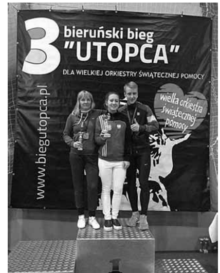
Reprezentanci gminy Bestwina na podium