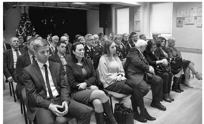
Goście uroczystej, noworocznej sesji