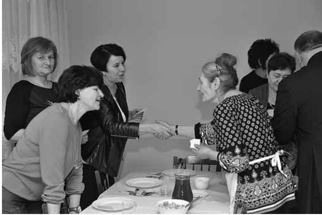
Spotkanie przebiegało w prawdziwie świątecznej atmosferze