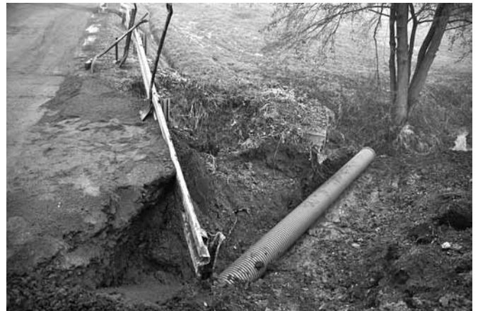
Ul. Podleska - wymiana rur