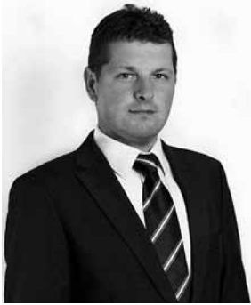
Wójt Gminy Bestwina Artur Beniowski