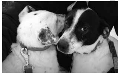
Bolek i Lolek

UWAGA! Jeśli posiadamy już zwierzęta a ich schronienia znajdują się na zewnątrz, w zimie nie zapomnijmy o zabezpieczeniu legowisk przed mrozami!