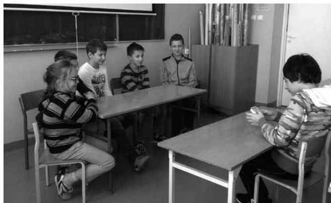
Pierwsze kroki do pracy w prawdziwej redakcji