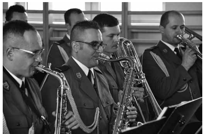
Policyjna orkiestra zagrała wiele znanych przebojów i kolęd