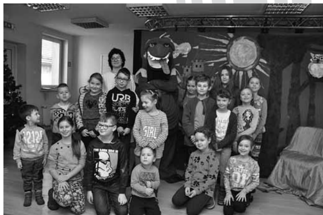
GOK - przedstawienie na motywach legend krakowskich