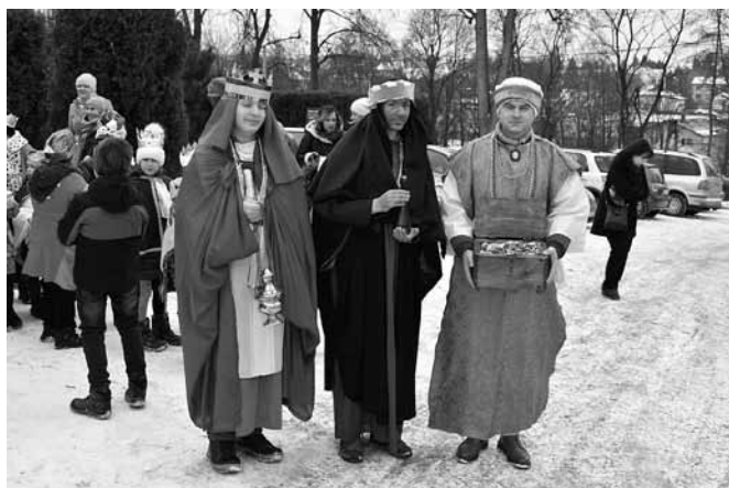
Bestwińscy Trzej Królowie

W dawnym, tradycyjnym rycie poświęcenia kredy kapłan mówił: „ Pobłogosław, Panie Boże, tę stworzoną przez Ciebie kredę, aby była zbawienna dla rodzaju ludzkiego, i udziel przez wezwanie Twego Świętego Imienia, aby ci, którzy ją zaborą lub napiszą na drzwiach swoich domów imiona Twoich świętych: Kacpra, Melchiora i Baltazara, przez ich wstawiennictwo i zasługi