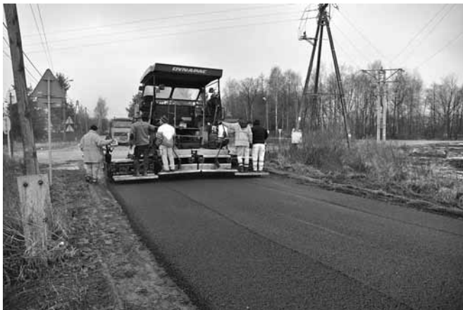
Asfaltowanie ul. Batalionów Chłopskich