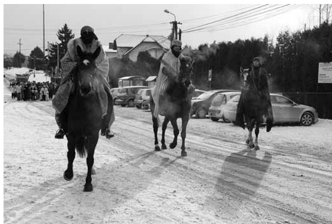
W Janowicach nie zabrakło jeźdźców konnych

otrzymali zdrowie ciała i opiekę dla duszy”. Dzisiaj, obok K+M+B używany jest niekiedy także zapis C+M+B co znaczy Christus mansionem benedicat – Niech Chrystus błogosławi mieszkanie .