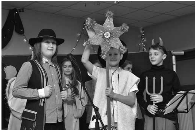
Hej kolęda, kolęda!

„Przynosimy wieść o cudzie, co po całej ziemi grzmi!” – obwieścili młodzi kolędnicy, uczniowie Zespołu – Przedszkolnego w Kaniowie. Dobra Nowina obiegła niczym Gwiazda Betlejemską salę Domu Strażaka w Kaniowie a melodie polskich kolęd