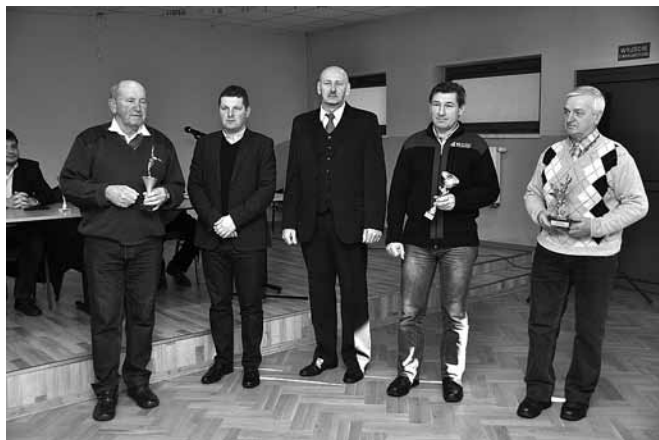
Rozstrzygnięcie konkursu na „Wędkarza Roku”