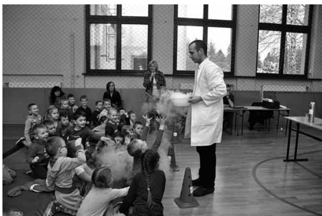
Mali studenci uczestniczyli w ciekawych eksperymentach

proszeni specjaliści z różnych dziedzin zaznajamiają dzieciaki z chemią, fizyką, biologią, technologiami komputerowymi itd.” – wyjaśnia koordynatorka projektu.