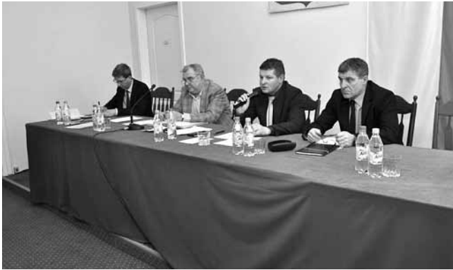
XXIII Sesja - stół prezydialny

wej sali gimnastycznej gdyż obecna nie jest wystarczająca do sportowego rozwoju siódmo – i ósmoklasistów.